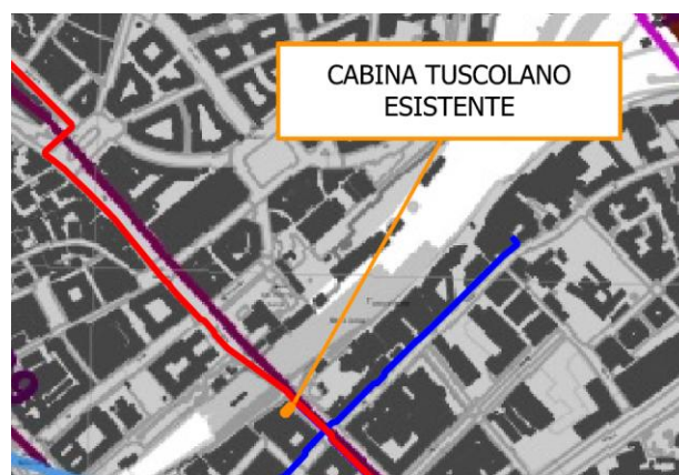
Stralcio Tavola B del PTPR

L'area oggetto di intervento non risulta interessata dalla presenza di beni paesaggistici di cui all'art. 134 comma 1 del DLgs 42/2004 e pertanto le opere non sono assoggettate alla disciplina di cui alle NTA del vigente PTPR approvato con DCR n. 5/2021 e al rilascio dell'autorizzazione paesaggistica ex art. 146 del DLgs 42/2004.